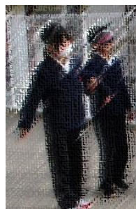
【相手の心に寄り添って】