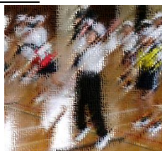
【上手くジャンプできたよ!】

リズムジャンプは、軽快な音楽に合わせて様々なジャンプやステップを踏む運動です。今回は、ビートに合わせて体を左右に振ったり、ひねったりしながら進む「ラインジャンプ」に挑戦しました。少しずつ難易度が上がっていくステップにもすぐに対応し、心地よい汗をかきながら、運動の楽しさを味わうことができました。