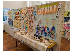
【温かな空気に包まれた会場】

本校からは、御津の四季を表現した共同作品と、陶芸作品を展示しました。感性豊かな作品の数々が並び、会場は多くの来場者で賑わいました。