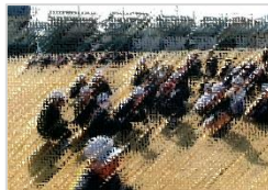
【運動場中央に集まった子どもたち】

「自分の命を自分で守れる子」をめざして、ご家庭でも震災の教訓や防災について話し合ってみてください。