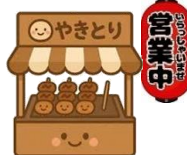
【今年は「やきとり」です】

ぜひ、ご家族で会場に足を運んでいただき、ほころび始めた梅とともに、早春のひとときをお楽しみください。