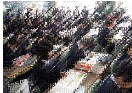
【4年生の国語「風船がうちゅうへ」】

大学より講師を招き、今年度最後の授業研究会を開催しました。市内各校の先生方も見守る中、子どもたちは教科書の記述を根拠に考えを深め、自分の言葉で堂々と伝え合うことができました。