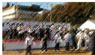
【寒空に軽快なリズムが響き渡りました】

今年は、たつの市制施行20周年を記念して、オープニングセレモニーに御津小中吹奏楽部も参加しました。その後も2回の演奏を行い、ランナーにエールを送りました。