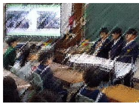
【入学したらいっしょにあそぼうね】

1年生が、来年度入学する園児たちとの交流会を開きました。給食や授業風景の写真を示しながら、「学校は楽しいよ」と、一生懸命に伝えました。その後、ペアになって手をつなぎ、トイレや保健室などをゆっくり丁寧に案内して回りました。