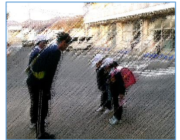
【あいさつ運動：寒さに負けない元気なあいさつで 最高の一日をスタートさせよう!】

2月4日は立春。暦の上では「春」ですが、まだまだ寒い日が続きます。子どもたちが年度末まで元気に登校できるよう、引き続きご家庭での励ましと健康管理をお願いします。