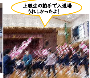
上級生の拍手で入退場うれしかったよ!