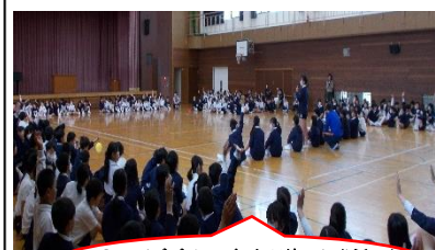
〇クイズでは、1年生が特にお世話になる先生たちのひみつがわかったよ!

上級生がつくる花道を通して1年生が入場しました。そして、「児童代表歓迎の言葉」のあと、この日のために6年生の児童が準備したクイズをして遊び、全校で楽しいひとときを過ごしました。