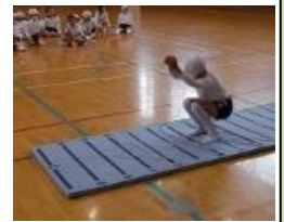
「エイッ!」何cmとべたかな。