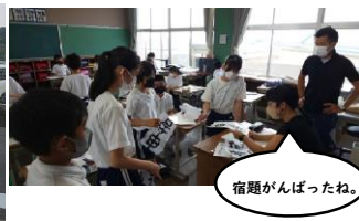
宿題ががんばったね。