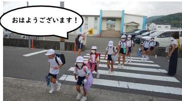
おはようございます!